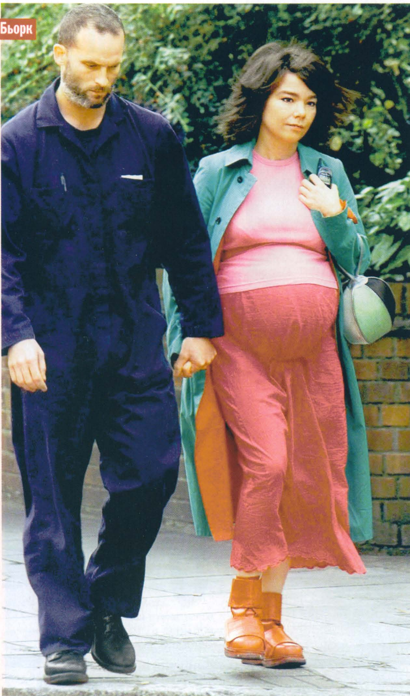
Мэттью Барни и раньше восхищался Бьорк – на расстоянии. Но когда увидел ее живьем – в безумном платье-лебеди, «откладывающей» яйцо на красной дорожке Каннского фестиваля, – то понял, что она женщина его мечты