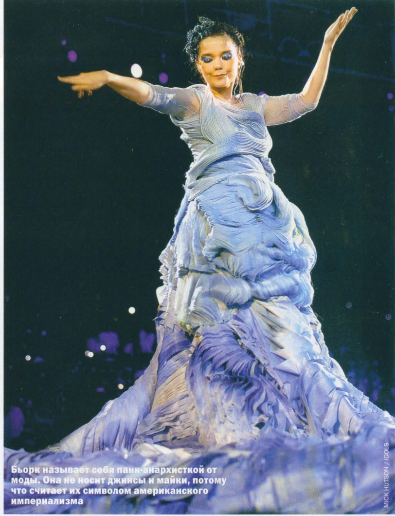
Бьорк называет себя панк-анархисткой от моды. Она не носит джинсы и майки, потому что считает их символом американского империализма