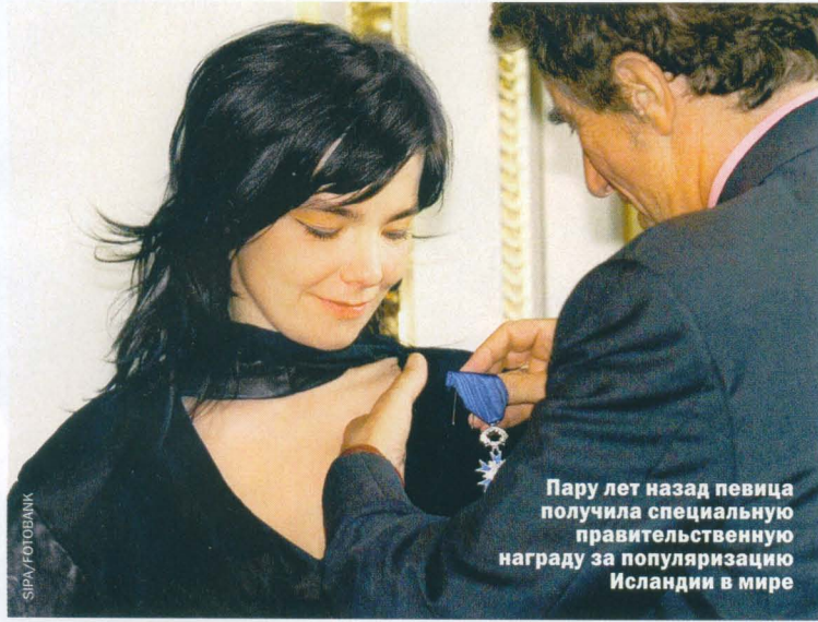
Пару лет назад певица получила специальную правительственную награду за популяризацию Исландии в мире