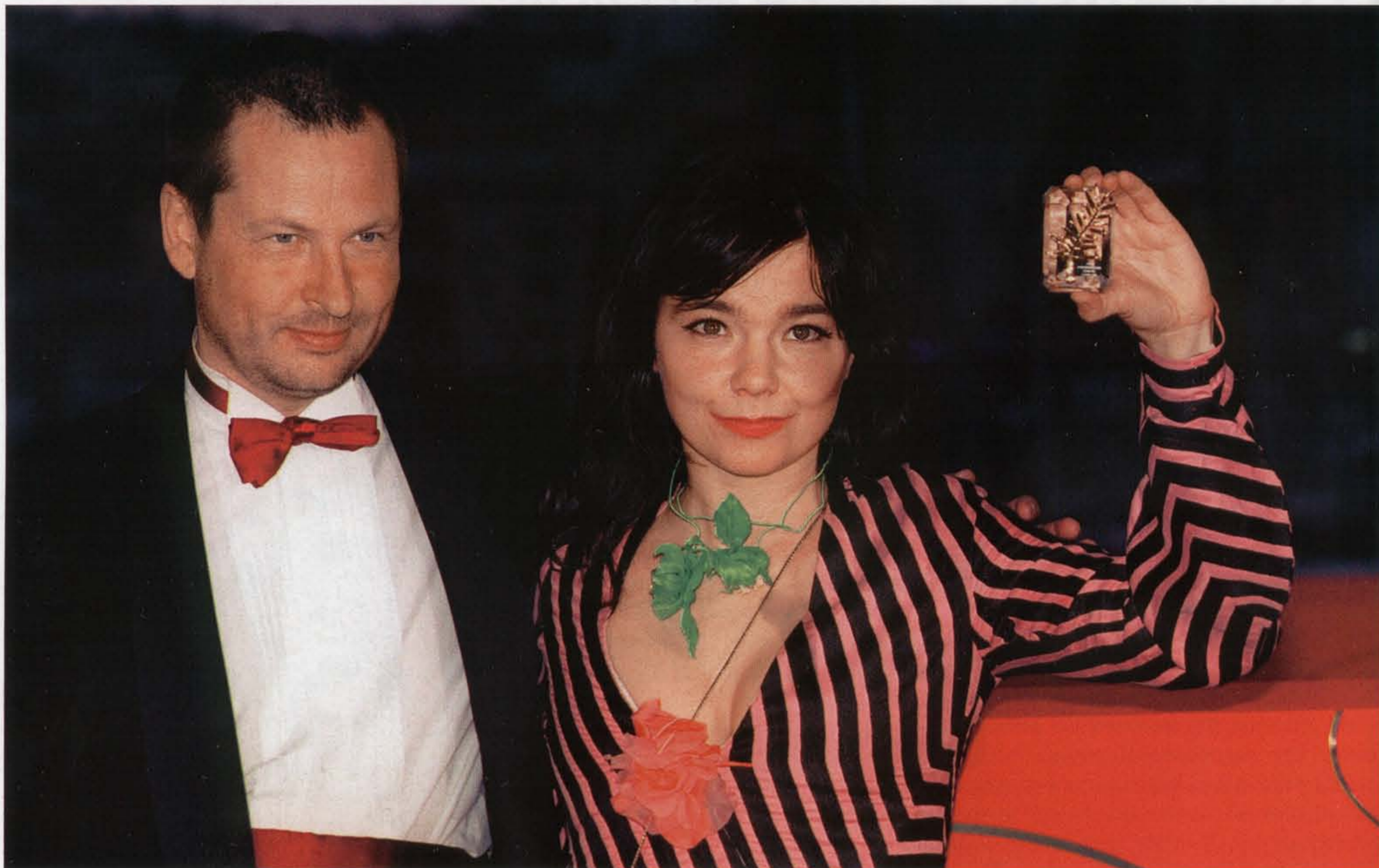
Когда Ларс фон Триер, режиссер «Танцующей в темноте», пытался ей указывать, как ходить в кадре и каким тоном разговаривать, Бьорк бросалась на него с кулаками