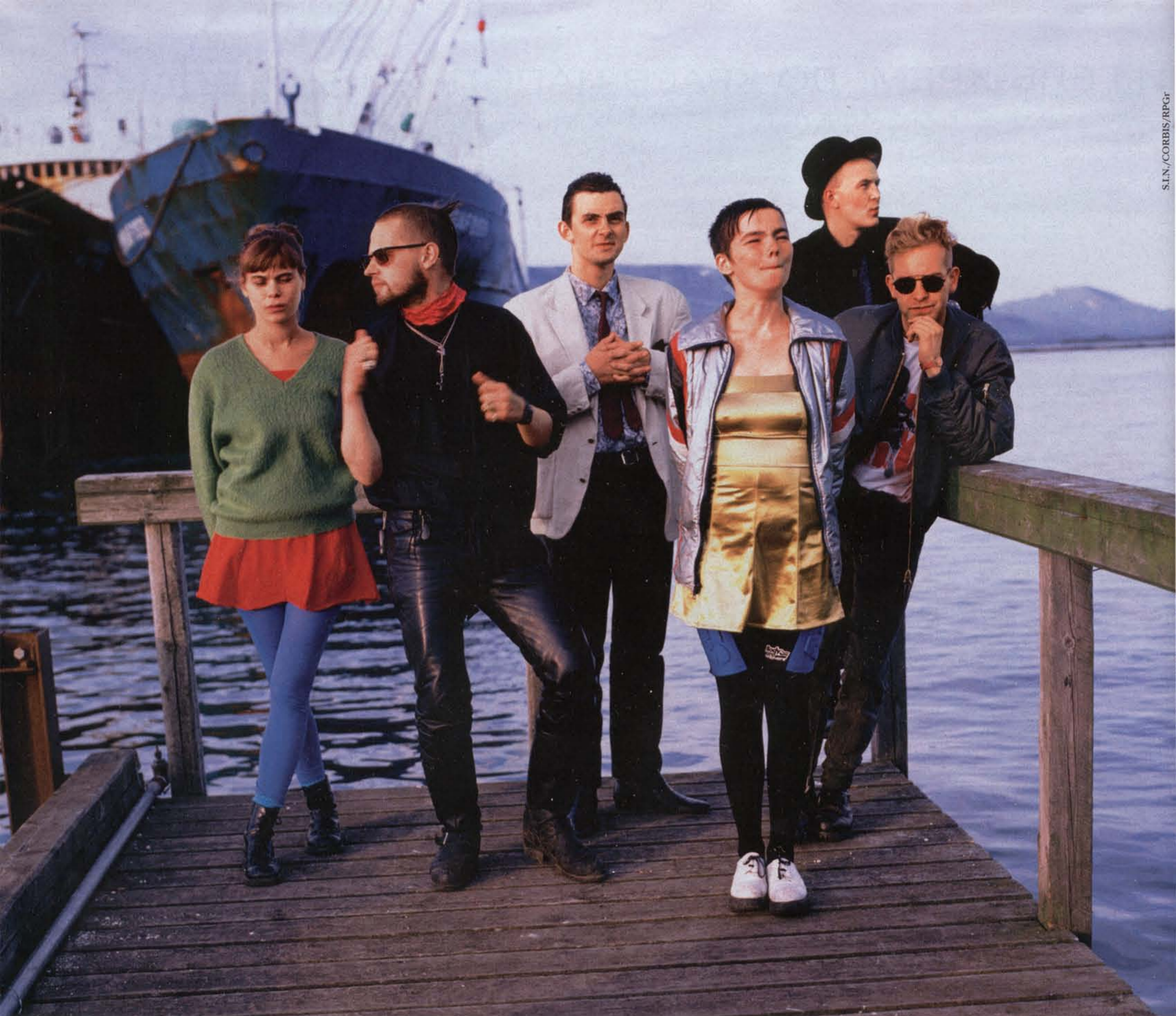
Об их с Тором группах — «Kukl», а затем и «Sugarcubes» — заговорили не только в Исландии, но и в Англии и даже в Америке. (На снимке: рок-группа «Sugarcubes», 1990 г.)