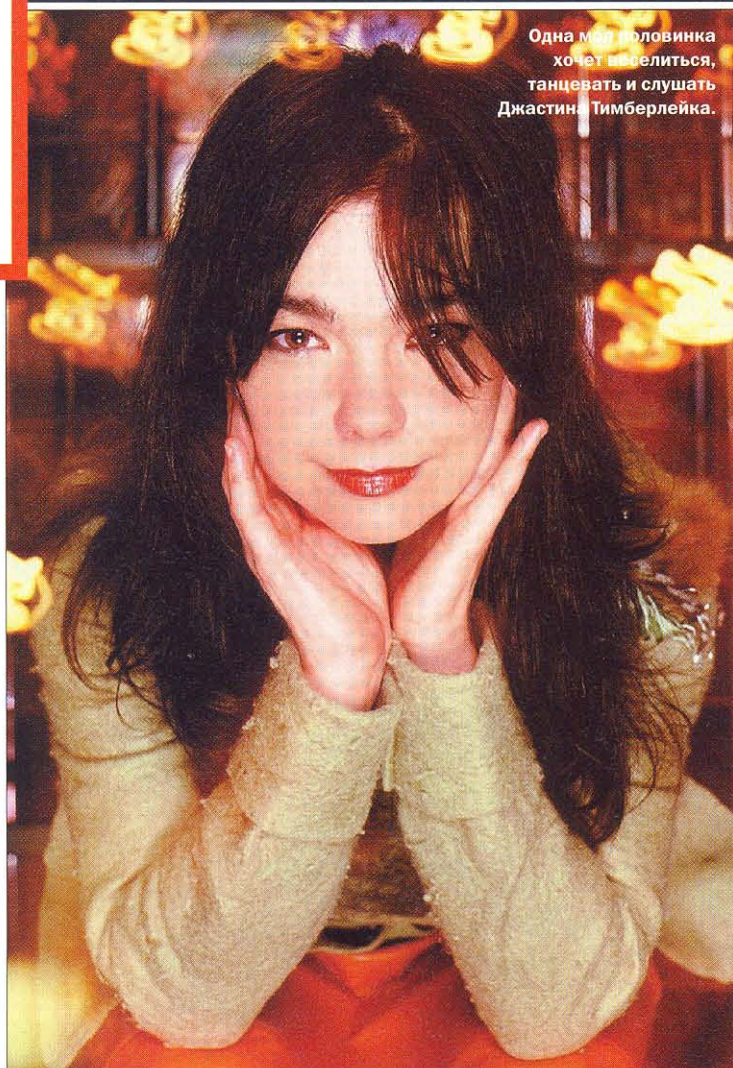
Одна моя половинка хочет поселиться, танцевать и слушать Джастин Тимберлейка.

Новый альбом « Medúlla » уже в продаже. www.bjork.com